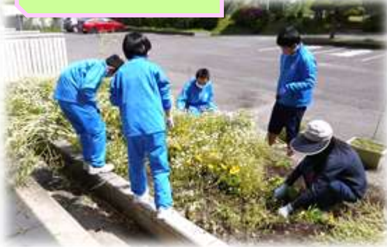
菜の花やパンジーなど枯れた花の撤去