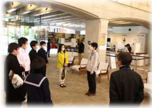
↑学芸員さんから、鑑賞の極意を教わりました。