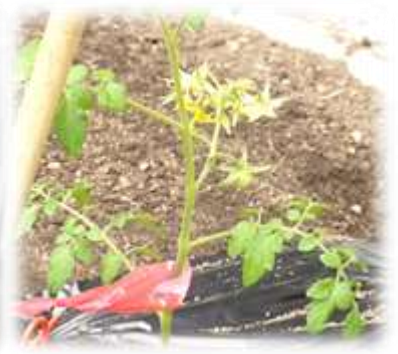
ミニトマトが花を付けました。