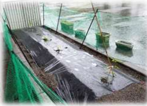
畑にマルチを張って苗を植えました。