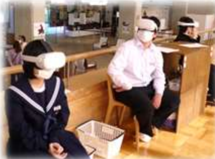
↑VRゴーグルの体験中